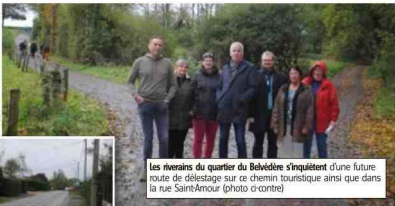
Les riverains du quartier du Belvédère s'inquiètent d'une future route de délestage sur ce chemin touristique ainsi que dans la rue Saint-Amour (photo d'orientation)

● Julien Bill On le sait ! Les parkings durbuyiens sont saturés les week-ends de grosse affluence. Afin de désengorger la plus petite ville du monde, la Ville de Durbuy a le projet de créer un parking nord, au lieu-dit Fond de Vedeur, le long de la route de Toghne. Dans ce cadre, un projet de modifications de voiries vient d'être dernièrement soumis à une enquête publique. Son dénominateur exact : « mise en œuvre du projet de parking Nord et mise en route du projet de contournement Nord de la Ville de Durbuy ». Cette éventuelle route de délestage, qui partirait du futur parking Nord pour arriver dans le quartier du Belvédère et la rue Saint-Amour, située sur les hauteurs de Durbuy, via l'actuel chemin touristique et la rue du Plâtre, inquiète profondément les riverains de ce quartier résidentiel. « Nous avons été très surpris à la lecture de cette procédure d'enquête publique. Même si, à l'heure actuelle, le document ne porte pas sur cette route de délestage, elle y est déjà pleinement envisagée. Or, ce projet de contournement nord